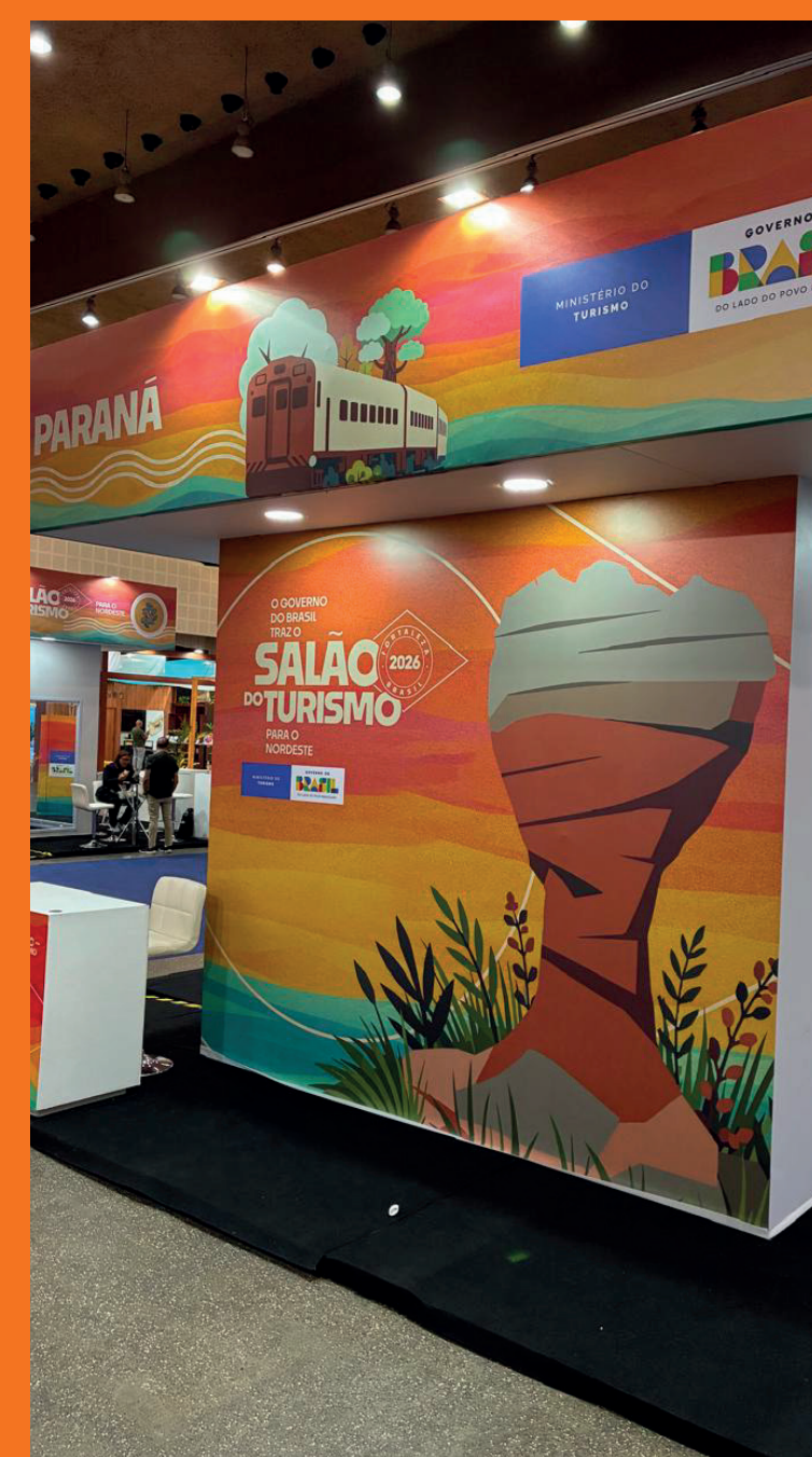
Salão Nacional de Turismo