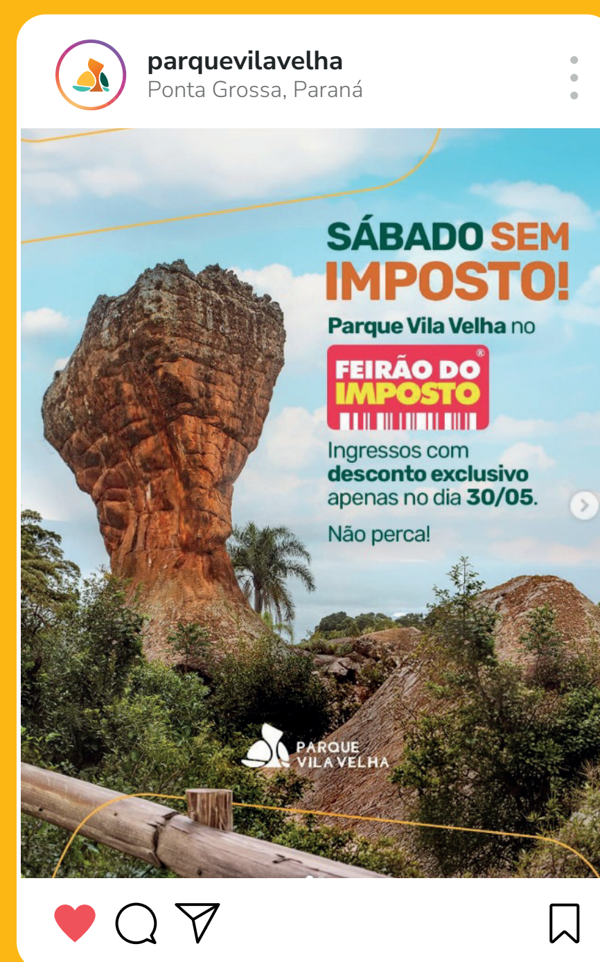
Feirão do Imposto