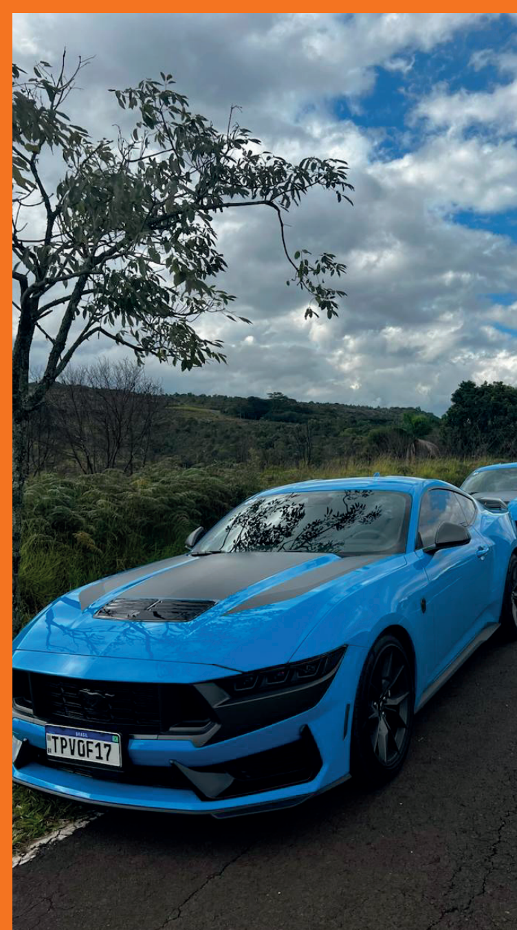
Driving Experience Mustangs