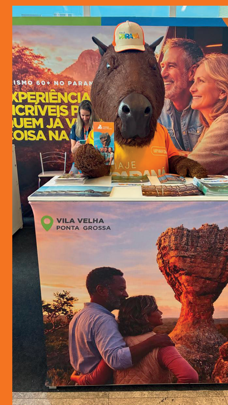
Fórum de Turismo +60