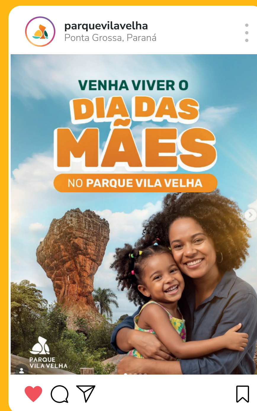
Dia das Mães